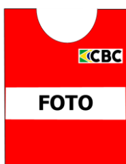
c.2. COLETE FOTO -