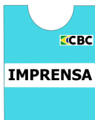
c.4. COLETE IMPRENSA -

d. Pulseira para convidados - será 1 pulseira de cor única.